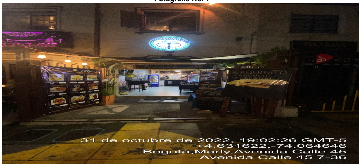
Fotografía No. 1

En la cual se evidencia la fachada del establecimiento comercial LA REGISTRADORA BURROPAN , en la CL 45 No. 7 – 36 de la localidad de Chapinero.